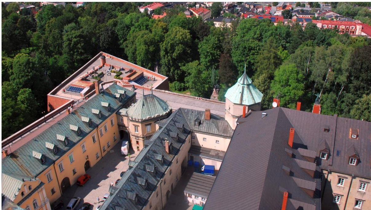
Zabudowania klasztorne Jasnej Góry wraz z otaczającym je lasem od strony północnej