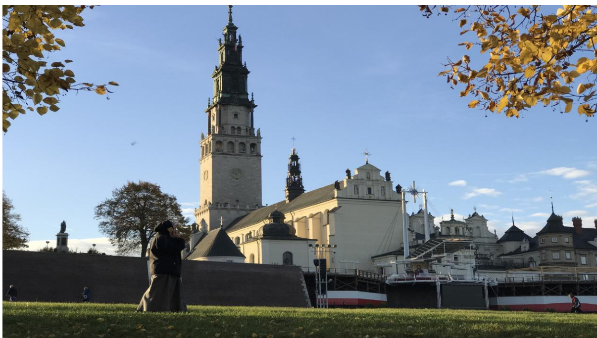
Widok od strony wschodniej na klasztor i bazylikę wraz z przedpołem widokowym