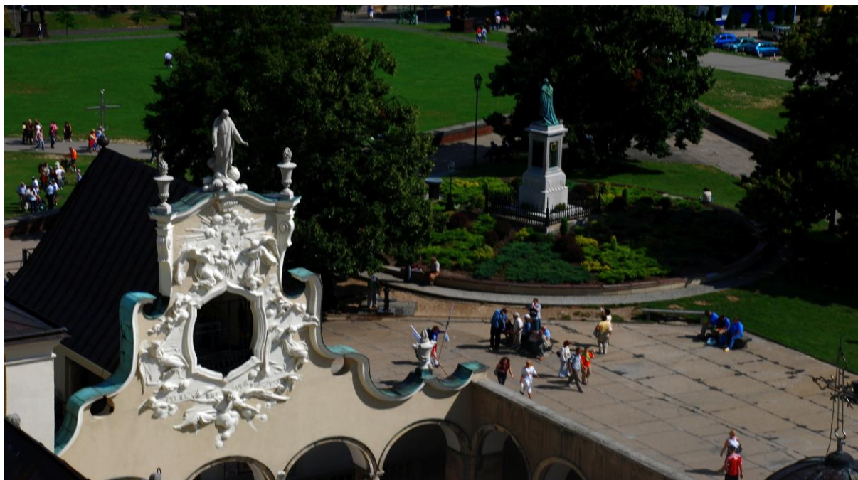
Klasztor Jasna Góra, widok na pomnik o. Augustyna Kordeckiego oraz przedpole widokowe klasztoru