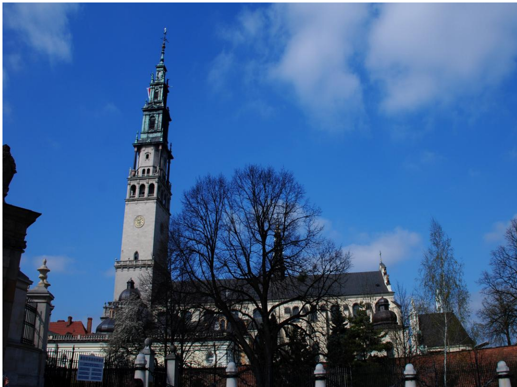
Bazylika Jasnogórska, widok od strony południowej – dominanta krajobrazowa